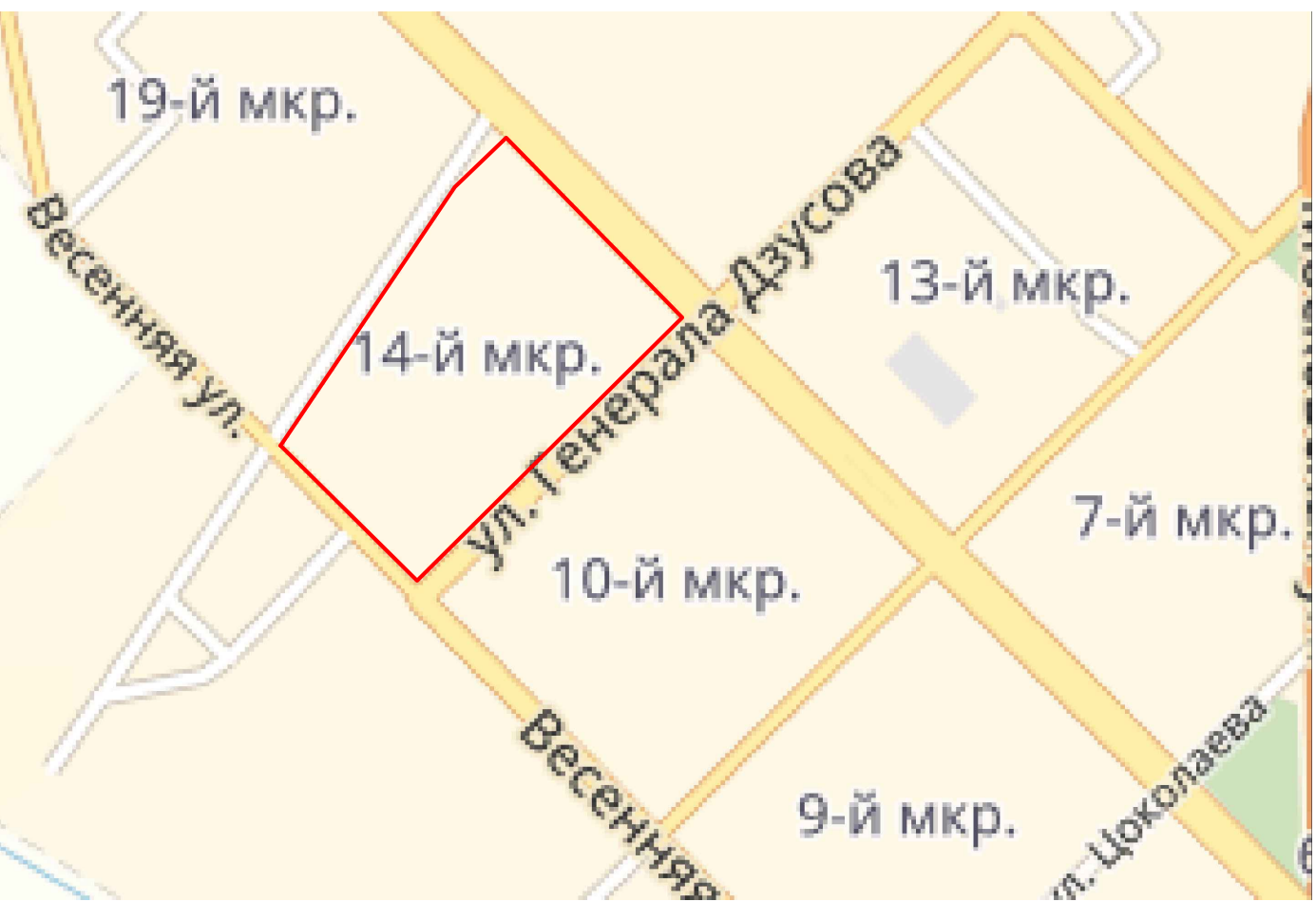
Ситуационный план М 1:500